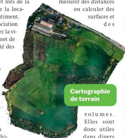
Cartographie de terrain

Comme dit précédemment, je crée des cartes 2D/3D très précises. Ces cartes peuvent avoir de nombreuses applications ; elles permettent de mesurer des distances ou calculer des surfaces et des