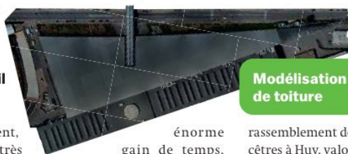
Modélisation 3D de toiture

Etablir ces relevés via un drone, avec ensuite transmission des données quasi immédiates via un ordinateur, constitue un